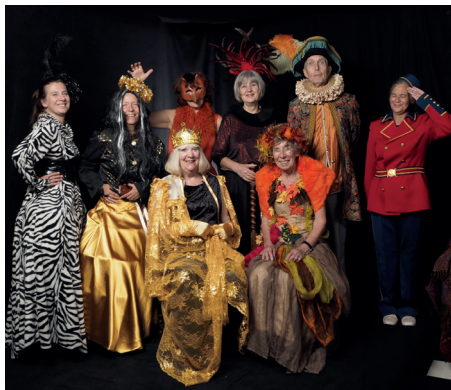
Vrijwilligers tijdens de NATMFK - Night at the museum for Kids

Er werden griezelsprookjes voorgelezen en de heks van Sneeuwwitje deelde appels uit die ter beschikking waren gesteld door Groente- en Fruithandel Koos Bertels in Delft.