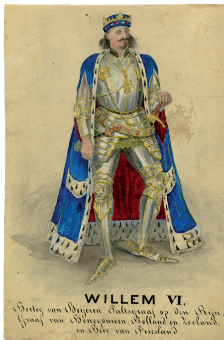
Maskerade 1878, De intocht van Willem VI, aquarel (collectie DSC)