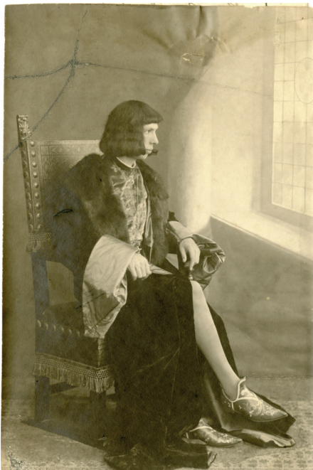
Lorenzo de Medici