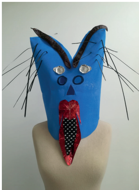
Resultaat van de workshop van Gonny Stuit

Op de heringerichte zolderverdieping werd een aantal workshops georganiseerd in het kader van de maskerade-tentoonstelling. In verband met de Museumnacht Kids deed Gonny Stuit een aantal workshops 'griezelmaskers maken'. De maskers waren daarna een aantal weken in het museum te zien. Ook de eigen 'educatiedames' waagden zich aan de maskers: op diverse dagen in weekenden en vakanties begeleidden zij kinderen bij het versieren van maskers.