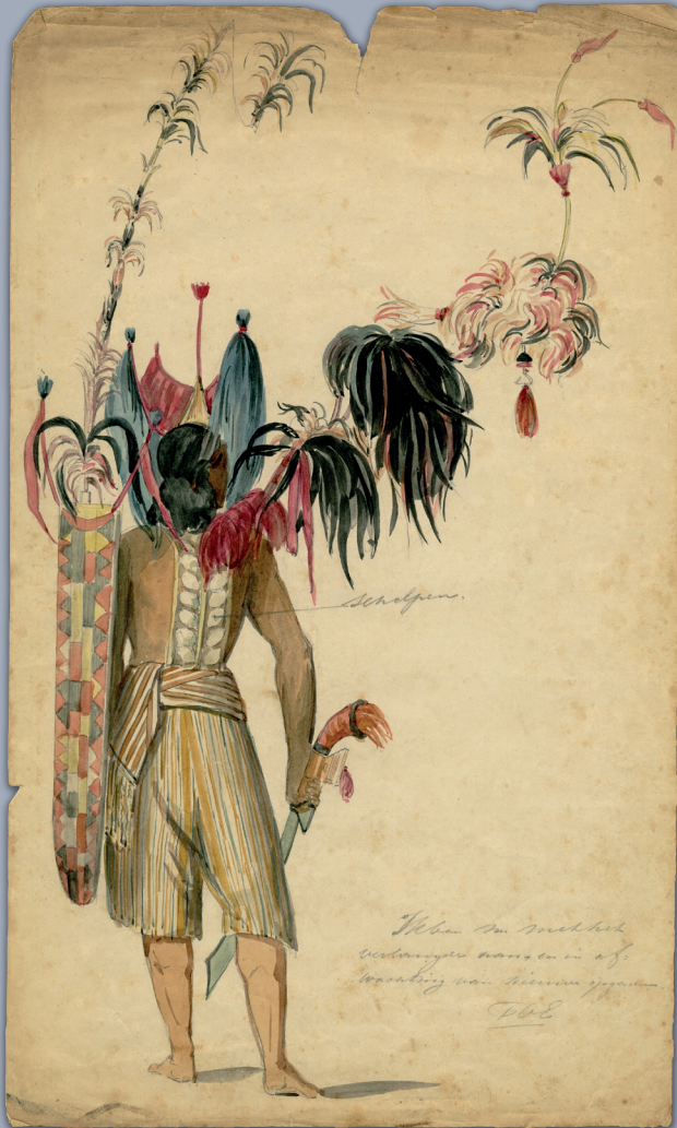
De voorvechter van het eiland Solor, aquarel door Paul Tetar van Elven