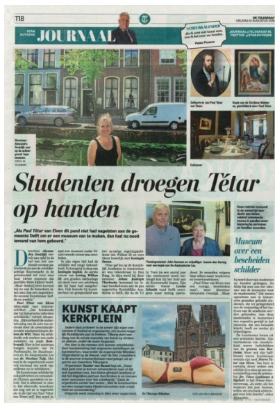
In het In het dagblad De Telegraaf verscheen op 10 augustus een paginagroot artikel over ons museum, in het zogenaamde Stan Huygensjournaal.