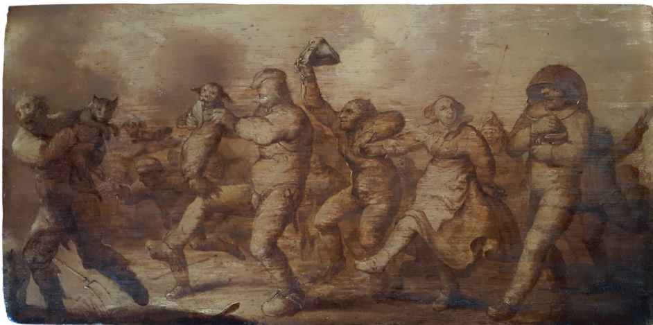
Adriaan van de Venne, Optocht met katten

Die lijken als het ware ingebakerd te zijn, je zou kunnen denken aan 'een kat in de zak', maar het blijft gissen.